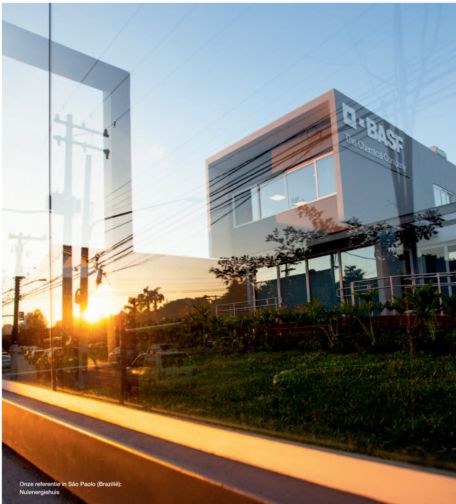
Onze referentie in São Paulo (Brazilië): Nulenergiehuis