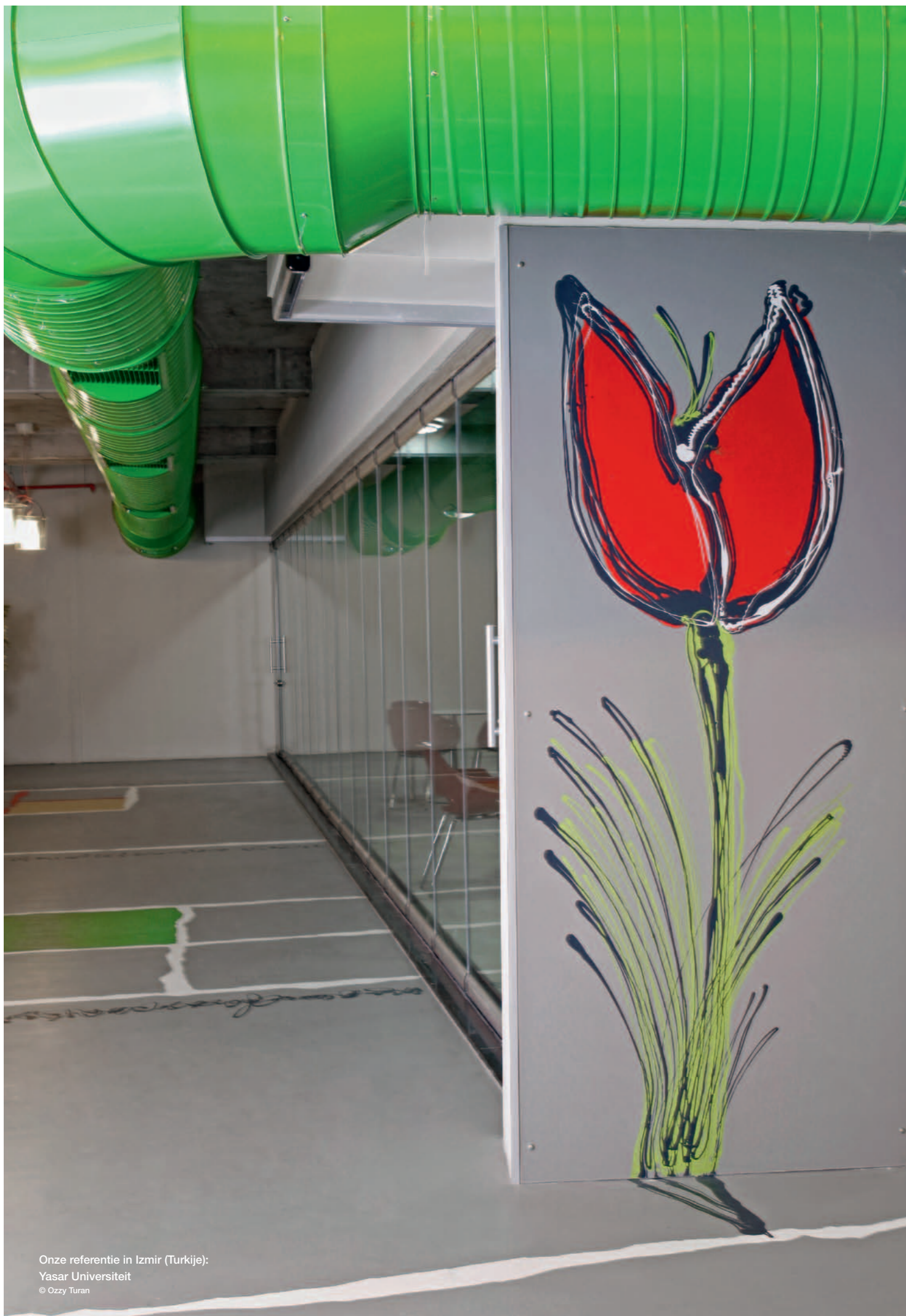
Onze referentie in Izmir (Turkije): Yasar Universiteit

Wanneer u kiest voor MasterTop 1327 creëert u een aangename atmosfeer van hoge kwaliteit – op de juiste basis.